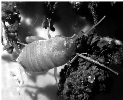
図1. サトアリツカコオロギ (体長 2.0 mm).