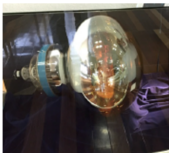
写真2 展示中の光センサー (光電子増倍管) 直径 50cm

をビッシリ敷き詰めて (写真3)、ニュートリノが水とぶつかるチャンスを待ち構えています。タンクの大きさは、富山市科学博物館の建物の2倍ほど (写真1)。このように巨大な装置でも、一日のうちに観測できるニュートリノの数は20~30個です。少ないチャンスを積み重ねて、精密にデータを分析し、地球の大気で発生するニュートリノの割合が飛んでくる方向によって異なることを見抜き、そこからニュートリノに質量があるという、世界初の大発見ができ、ノーベル賞につながったのです。