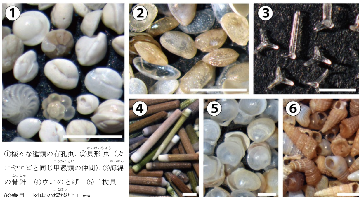
①様々な種類の有孔虫。②貝形虫（カニやエビと同じ甲殻類の仲間）。③海綿の骨針。④ウニのとげ。⑤二枚貝。⑥巻貝。図中の横棒は1 mm.

今月のかぐのギモン：星の形をした砂「星の砂」をお土産でもらいました。これはいったい何ですか？（答えは当館ホームページをご覧ください）