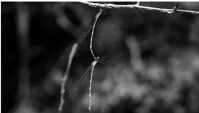
図2 ホソミオツネントンボ♂同士の連結 射水市(小杉町) 西谷 2018年3月28日.