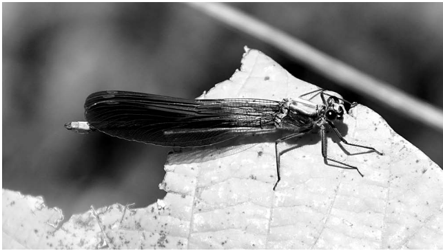
図3 ニホンカワトンボ♂ 上市町野島 2018年12月2日.