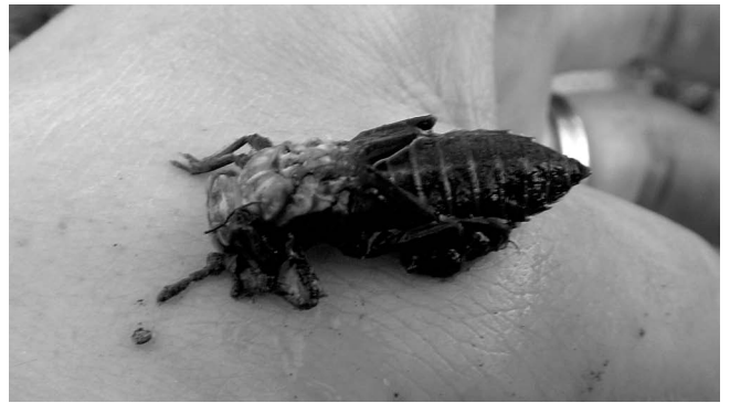
図6 ミヤマサナエ羽化不全 滑川市中村 2016年4月19日.