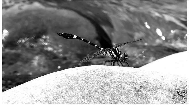
図5 オナガサナエ♂ 富山市(婦中町)蓮花寺 2018年8月19日.