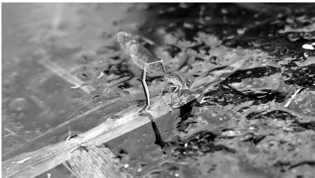
図4 アジイトンボ♀産卵 富山市(婦中町)上轡田 2018年12月4日.