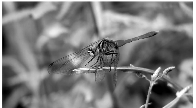
図8 マユタテアカネとマイコアカネの種間雑種(?)♂ 富山市(婦中町)上轡田 2018年9月14日.