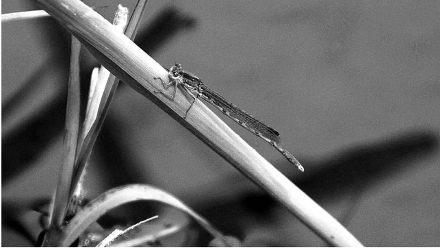
図1 オツネントンボ♂ 射水市(新湊市)海竜町 2018年5月12日.