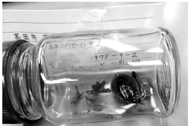
図1 標本発見時の保存状況(撮影のために一時的に横倒した)。ラベルは蓋に粘着テープで貼り付けてあった。

形態観察には双眼実体顕微鏡「Leica SAPO」を用いた。各部位の計測は、双眼実体顕微鏡「Leica SAPO」