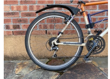
図1 自転車の後輪側

そのヒミツは、後輪の軸に組み込まれている「ラチェット」というしくみにあります。自転車のラチェットは図2のように、内側がギザギザしたつつ形の部品(チェーン側)と、ツメのついた円柱状の部品(タイヤの軸)が組み合わされています。チェーンが右回りに回ると、ギザギザにツメが引っかかりタイヤの軸も回ります。しかし、逆回りするとツメが倒されるためかみ合わず、タイヤの軸は回りません。