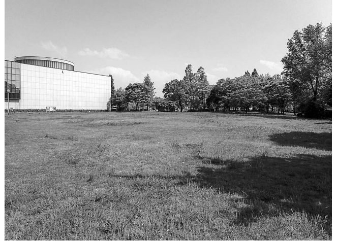
図1 城南公園の概観。2021年5月9日撮影。

記録地点である城南公園は、住宅地に囲まれた都市公園である。公園の半分程度は芝地, 残る半分は植栽され