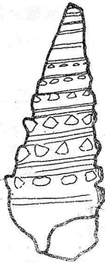
正常な八尾産の ビカリヤ

ある時、私は八尾の砂の地層の中から奇妙な貝化石を見つけました。ビカリヤとよばれる巻貝であることは形からすぐわかったのですが、からがつぶれて、おまけにビカリヤの特徴であるとげとげの突起が表面にはほとんどありません。さらにつる