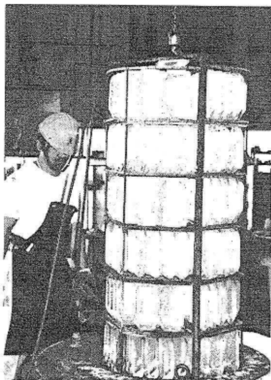
合成水晶の釜出し（東洋通信機宮崎工場）

水晶には特定の方向に電圧をかけると規則的に振動する「水晶発振」という性質があり、時計などに利用されてきました。近年時計の精度が飛躍的に良くなったのは、この「水晶発振」を利用したからです。