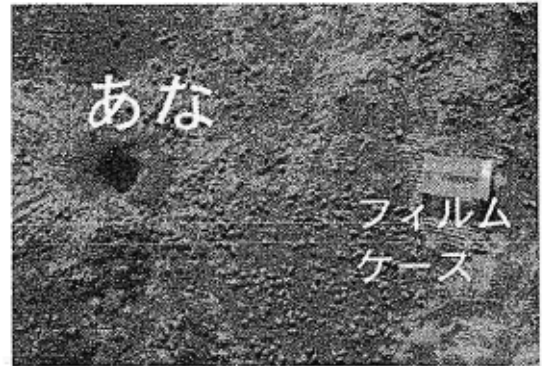
すなはま 砂浜のあな：どんな生きものがあけたのかな？

すなはま 砂浜に直径 1-2cmほどの穴があいている のが見られますが、どんな生きものが穴 をあけているのでしょうか。