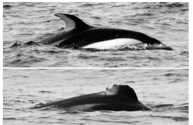
図2. 富山市岩瀬沿岸に出現したカマイルカ(上, 背ビレ, 胴部の模様がカマイルカの特徴を備える. 下, 背ビレの先端が欠損しているカマイルカ.