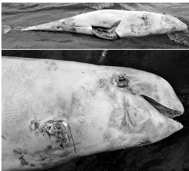
図3. 氷見市漂着ハナゴンドウ。 上, 胴部 (腹側); 下, 頭部 (右側)。