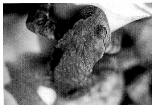
図5 手首に抱接するナガレヒキガエル