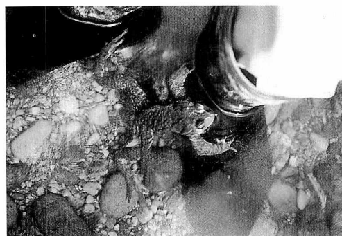
図4 長靴に抱接しようとするナガレヒキガエル