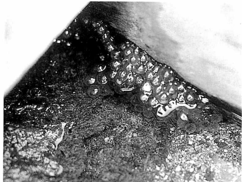
図2 タゴガエルの卵塊

第2例. 筆者によるナガレヒキガエルの異常抱接の観察。1978年7月20日の日中、石川県金沢市森本川源流の、川底が岩盤状の谷川で、ナガレヒキガエルのオスを1個体を発見した。ナガレヒキガエルは筆者に近づき(図3)、さらに履いていた黒いゴム長靴に抱接しようとした(図4)。しかし、長靴が大きく抱接できず、長靴の周辺に留まっていたので、左手を差し出すと手首に抱接してきた(図5)。かなり強い力であり、歩いても離れようとせず、