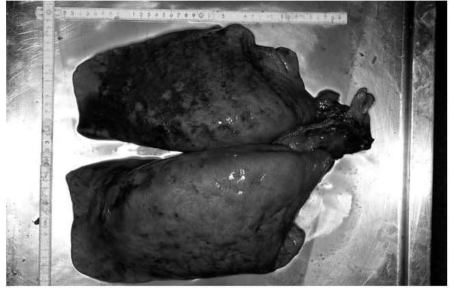
図2 肺気腫が認められた肺

胃：前胃；内容物はアジ科マアジと思われる未消化な個体13匹，多量の暗灰色流動物および十数隻の Anisakis sp. 線虫をそれぞれ認める。粘膜は白色角化上皮が裏打ちする。弾力性なし。主胃；内容物は暗灰色流動物。粘膜は灰赤桃色を呈す。径1cm大に至るクレータ状潰瘍を3，4個認め， Anisakis sp. 線虫が食い込むものもある。幽門胃；粘膜は緑黄褐色を呈し，弾力性に乏しい。