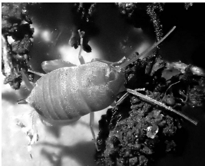
図1. サトアリツカコオロギ (体長 2.0 mm).