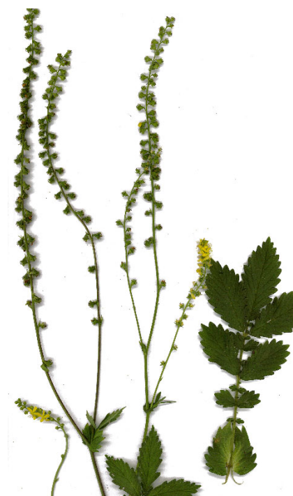
図2 高さ50cm程の草で、実が縦につく穂をもつ