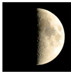
じょうげん つき 上弦の月