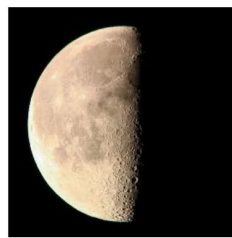
かげん つき 下弦の月