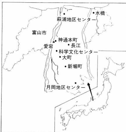
図1 観測地点の位置

教室ではpHとナトリウムイオン、アンモニウムイオン、硫酸イオンの分析を行った。また、その他の成分については著者が後日分析を行なった。