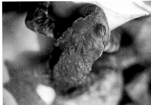
図5 手首に抱接するナガレヒキガエル