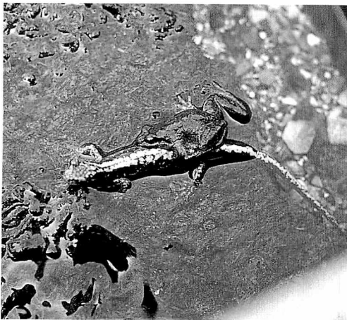
図1 タゴガエルとハコネサンショウウオの抱接

1989年7月26日午前9:00、北アルプス朝日岳から白馬岳へ向かう途中の通称「子桜原」(標高約1980m)の木道が設置してある湿地で、カエルがサンショウウオに抱接しているのが観察された。最初は胴部の前後に2個体が抱接していたが、近づき棒でつつくと前方の1個体が離れ、後方の1個体はそのまま残