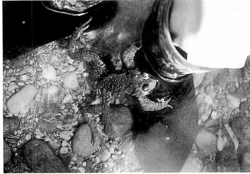
図4 長靴に抱接しようとするナガレヒキガエル