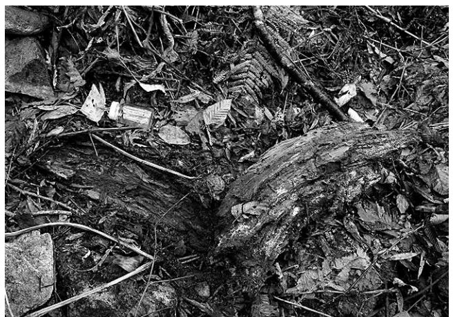
図2 ガロアムシのいた朽木

1: 富山市有峰真川下流, 2: 富山市有峰大多和峠, 3: 富山市八尾町白木峰